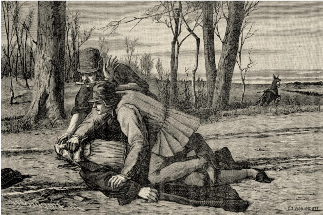
De aanslag op tSerclaes

vervolgens Brussel in en plantte als teken van zijn heerschappij zijn banier bovenop het stadhuis. Sinds de 19e eeuw is men echter verkeerdelijk gaan stellen dat de Vlaamse vlag op het huis de Ster wapperde.